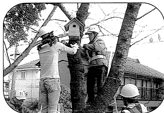
【大山里親事業】 巣箱清掃後の取付け作業