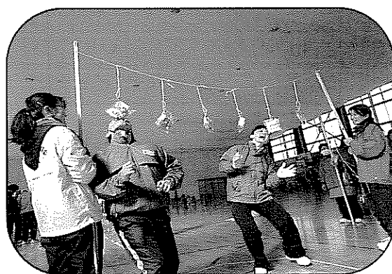
【運動会事業】 パン食い障害物競争